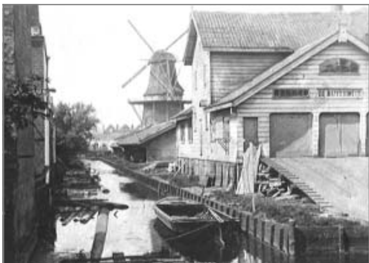
1890 - Houtzagerij De Nijverheid en molen ter hoogte waar nu de Crispijnstraat is. Gezien vanaf de Veenkade richting Elandstraat.