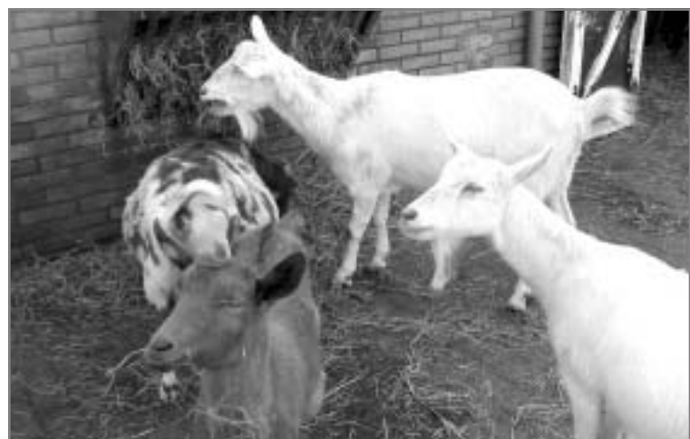
Kinderboerderij 't Beestenspul in de Tivolistraat, tussen de Westerbaenstraat en de Hemsterhuisstraat, is dagelijks geopend van 9.00 tot 17.00 uur. 's Maandags gesloten.