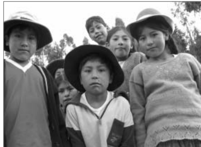
Al 40 jaar komt Terre des Hommes op voor de rechten van kinderen.

De actie wordt ondersteund door vele ondernemers uit het Zeeheldenkwartier, waar het hoofdkantoor van Terre des Hommes ook is gevestigd. Kinderen kunnen bij de ondernemers een gratis slinger ophalen en ermee aan de slag gaan. Als de slinger klaar is, kunnen ze die bij Terre des