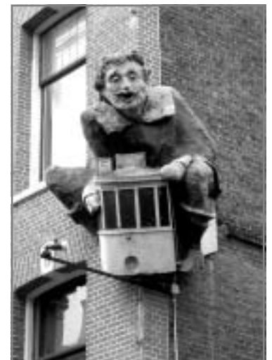
Zeeheld Witte de With aan de gevel in de Witte de Withstraat