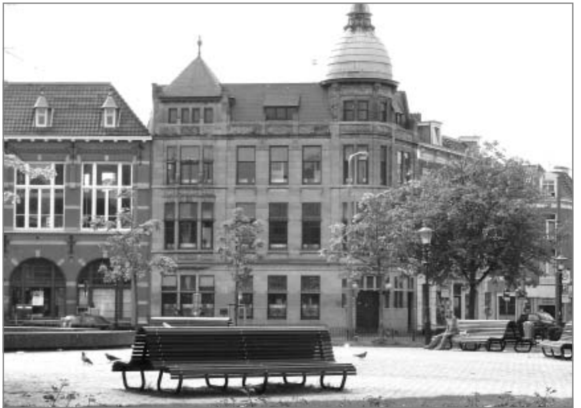
De werkgroep Kwartier in Kunst is bezig met het uitzetten van een wijkwandeling met aandacht voor architectuur, geschiedenis en grappige plekjes in het Zeeheldenkwartier. In de wandeling zijn ook de monumentale panden aan het Prins Hendrikplein opgenomen. Zie ook pagina 2.

Wellicht komen er ook nog andere suggesties naar voren. Van de avond wordt een verslag gemaakt, dat grotendeels in de Elandkrant zal worden geplaatst. Op deze wijze kunnen ook de niet-aanwezige wijkbewoners gestimuleerd worden om aan de slag te gaan.