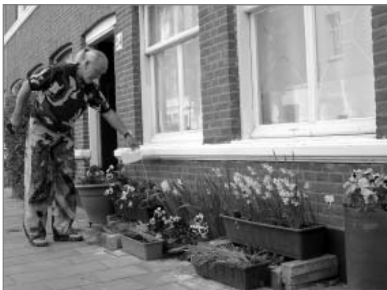
Een enthousiaste geveltuinier in de Hugo de Grootstraat.

De eigenaar is verantwoordelijk voor het onderhoud van de geveltuin en dient overhangende takken weg te snoeien, zodat ze voetgangers niet hinderen. Langs een gevel kan de grond erg droog blijven. Geef uw geveltuin daarom regelmatig water. Ook als het heeft