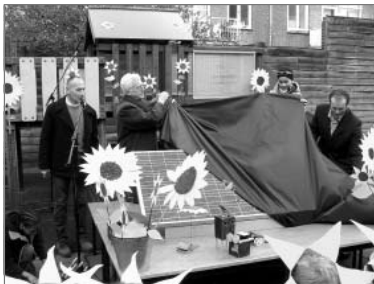
Zonnepanelen voor basisschool Het Kompas aan de Da Costastraat.