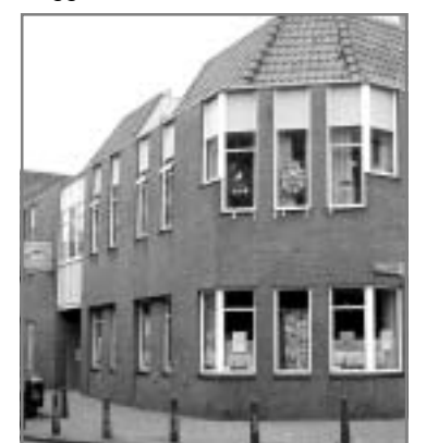
Buurthuis DeeDrie op de hoek van de Witte de Withstraat en de Roggeveenstraat

Het bestuur van bewonersorganisatie De Groene Eland stelt zich op het standpunt, dat sluiting van Deedrie onaanvaardbaar is.