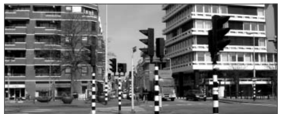
Piet Heinplein - Als de plannen doorgaan kan men vanuit de Anna Paulownastraat niet meer rechts de Elandstraat in of rechtdoor de Prinsessewal op rijden.