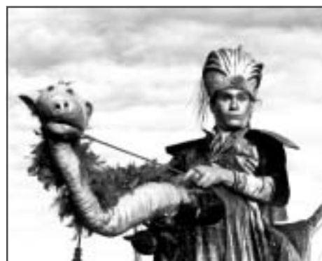
Khalid & Co