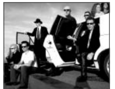
Zaterdag - Blues Rock 'n Soul Review

De eerste vier dagen van het Zeeheldenfestival worden er onder de naam: 'Love to paint' door kunstenaars uit de wijk, workshops gegeven in het beschilderen van panelen. Deze panelen worden na beschildering opgehangen op de hekken rondom het podium. Tijdens het festival kunnen bezoekers zich hiervoor aanmelden. Helpt u mee met dit kunstwerk in wording?