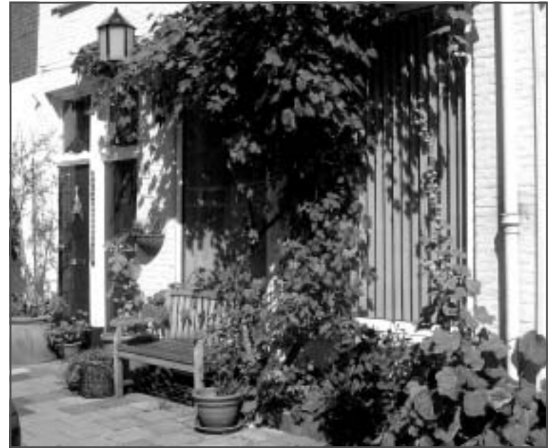
Deze geveltuin in de Tollensstraat was verleden jaar een van de prijswinnaars.

De bezitters van de drie mooiste of origineelste en best onderhouden geveltuinen krijgen een prijsje en een eervolle vermelding in de Elandkrant. Wilt u er zeker van zijn dat uw geveltuin niet wordt overgeslagen tijdens de keuring, geef dan uw adres door via elandkrant@worldmail.nl of telefoonnummer 070-3468271. In het septembernummer van de Elandkrant worden de prijswinnaars bekend gemaakt. Wellicht behoort u daartoe!