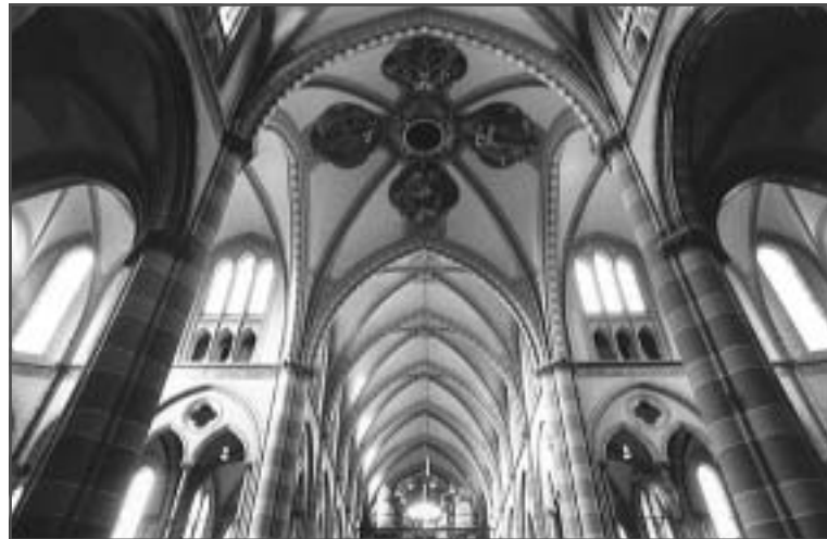
Plavondschildering in de Elandstraatkerk.

Dus geen aanleiding voor een feestje, maar wel een actie voor de restauratie van het orgel. Een aantal belangrijke stappen zijn al genomen: Sinds enkele jaren heeft het instrument de status van Rijksmonument; een restauratieplan opgesteld; offertes uitgebracht en de adviseurs hebben hun adviezen gegeven. Op korte termijn wordt de beslissing genomen welke orgelbouwer de restauratie zal gaan uitvoeren.