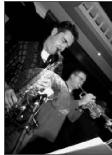
Woensdag - Ijdi