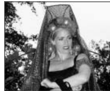
Donderdag - Da Gaia

Ook dit jaar loopt onze actie: Vrienden van het Zeeheldenfestival. Voor slechts tien euro kunt u ook een Vriend worden. U kunt zich tijdens het Zeeheldenfestival hiervoor aanmelden bij de informatiekraam. Een blijvende herinnering aan het 26 e Zeeheldenfestival krijgt u dan gelijk mee.