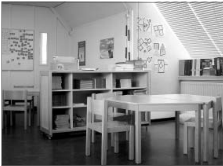
Het pand aan de Roggeveenstraat heeft in de zomer een flinke opknappbeurt gehad en er is nieuw meubilair aangeschaft.

Na een brand die in januari 2006 het pand aan de Tasmanstraat in de as legde, werd de Wereldwijzer tijdelijk aan de Beeklaan gehuisvest. In deze periode bleek