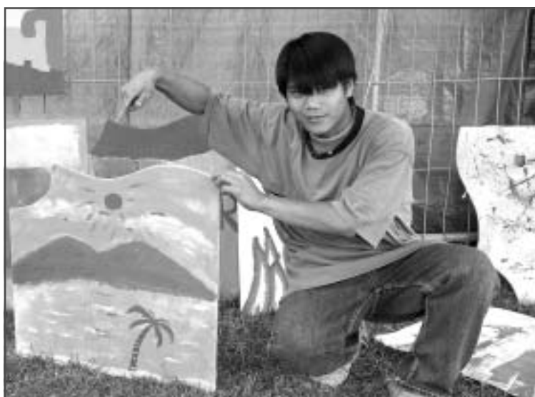
Tijdens het Zeeheldenfestival zijn foto's gemaakt van de workshop 'Love to paint'. De amateur kunstenaars kunnen hun foto ophalen bij de Groene Eland, Elandstraat 88a. Zie ook pagina 5.

Kijk op www.denhaag.nl , plannen en projecten, steentje bijdragen voor het formulier of stuur een mail naar wethouder Norder: M.Norder@bsd.denhaag.nl .