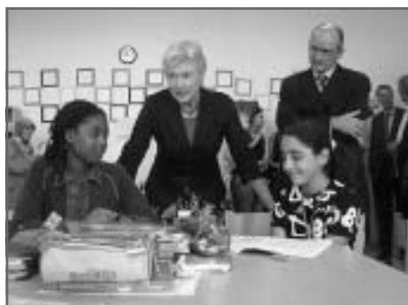
Minister van onderwijs Maria van der Hoeven verichte de officiële opening van het nieuwe pand aan de Roggeveenstraat.

Het docententeam bestaat uit 20 leerkrachten (inclusief 2 peuterleidsters / exclusief 6 SPW stagiaires, welke 4 dagen in de week voor een heel schooljaar aan de groepen zijn toegevoegd). Op de begane grond zijn de groepen 1-2 en 3 gelocaliseerd, op de 1 e etage de groepen 7 en 8 en op de 2 e verdieping zitten de groepen 4, 5 en 6.