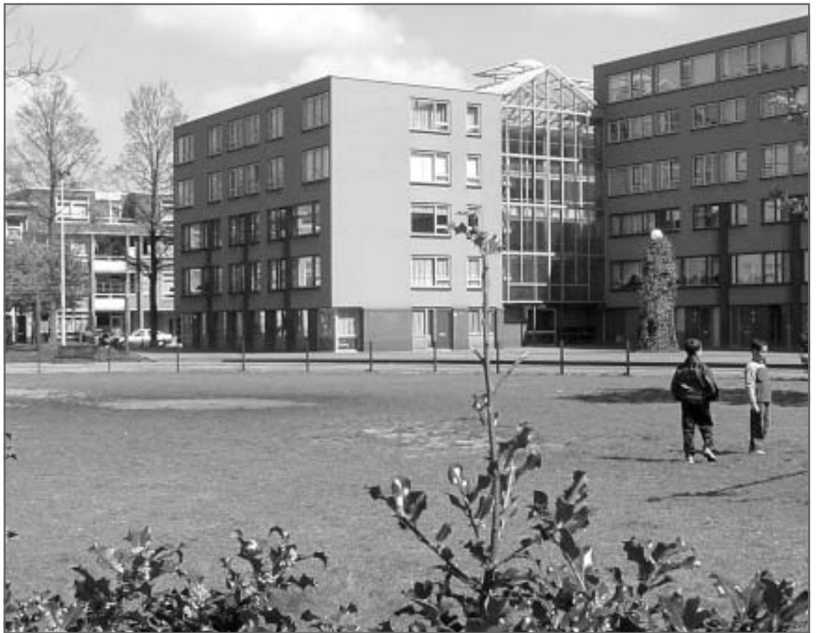
In tegenstelling tot diverse berichten in de media is het nog steeds niet zeker of er in het Jennyplantsoen een Cruyff Court komt. Het Jennyplantsoen zou dan namelijk volledig moeten worden aangepast. De gemeente is nog aan het beraadslagen of dat de moeite waard is, omdat het plantsoen qua indeling nog steeds voldoet aan de huidige eisen.