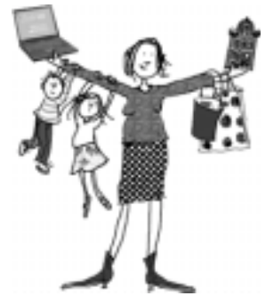
Illustratie: Gurli Feilberg

Hier in het Zeeheldenkwartier is het aantal thuiswerkmoeders legio: van project managers tot